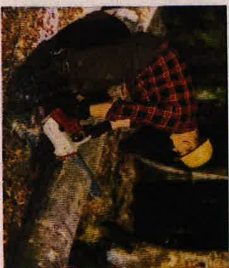
Vid alla de olika arbetsmoment som hör samman med kvistningen kan STIHL-08 lätt användas.