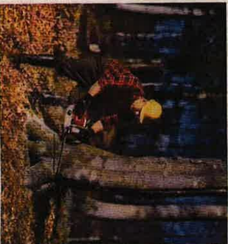
STIHL-08 användes för såväl löv- som barrträd. Trädgårdningen sker med hjälp av STIHL-08 mycket snabbt.

Användningsområdet för STIHL-08 är stort. Bilderna visar, att STIHL-08 kan användas på många olika arbetsområden. Sågen är tack vare den låga vikten lämplig för användning under svåra vinterförhållanden och under sommarid för röjningsarbete. Den låga vikten och det gynnsamma priset gör det möjligt för många olika yrkesgrupper att köpa och använda STIHL-08.