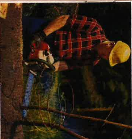
Även vid kvistning av barrträd är STIHL-08 idealisk.